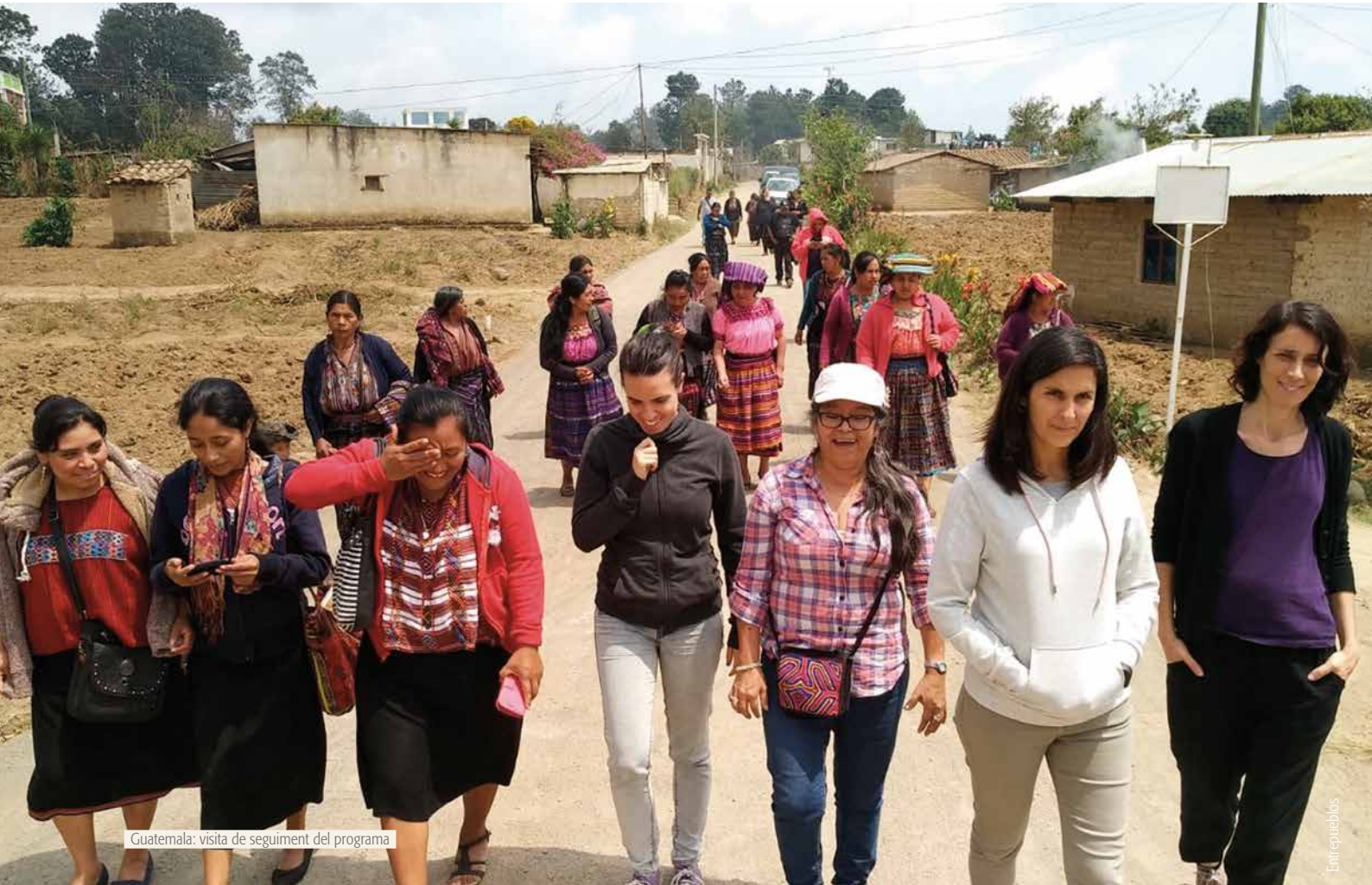
Guatemala: visita de seguiment del programa

Totes aquestes persones defensores son part d'una lluita global per a la defensa del territori-cos, la preservació dels ecosistemes i la protecció dels drets humans. Des de les aliances estratègiques forjades als moviments de solidaritat de l'Estat espanyol i d'Europa, estem contribuint a aquesta lluita , ampliant xarxes i coordinant accions per crear plataformes d'organitzacions per a la protecció de defensores i defensors, com