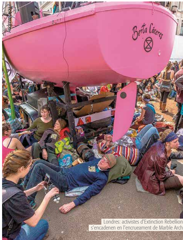
Londres: activistes d'Extinction Rebellion s'encadenen en l'encreuament de Marble Arch

Hem de ser conscients que, en tot cas, la important i molt positiva novetat d'aquests moviments recents consisteix en que