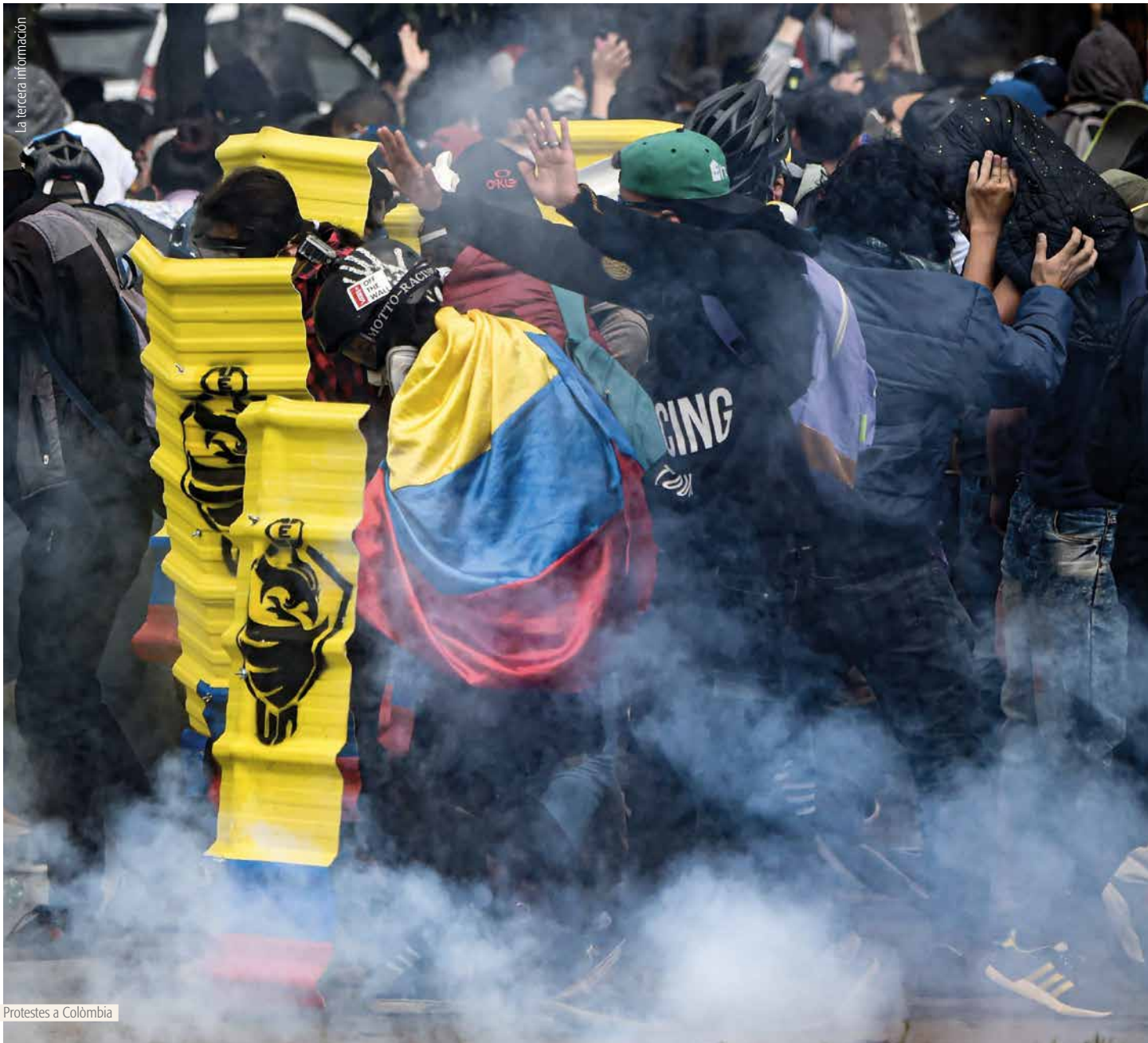
Protestes a Colòmbia

trades per agents de la policia que encoratgen saquejos que tornen la població en contra de les protestes.