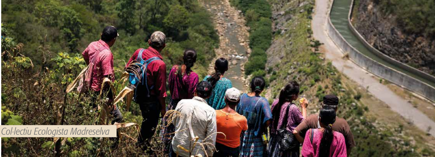
Col·lectiu Ecologista Madreselva

Violació del dret a la consulta, criminalització i judicialització del poble Maya Q'eqchi' de Santa María Cahabón