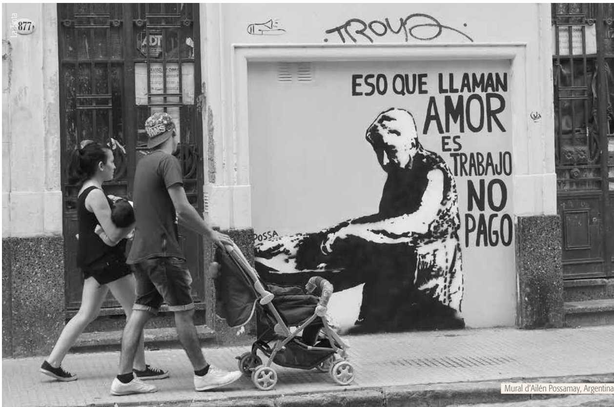
Mural d'Ailén Possamay, Argentina