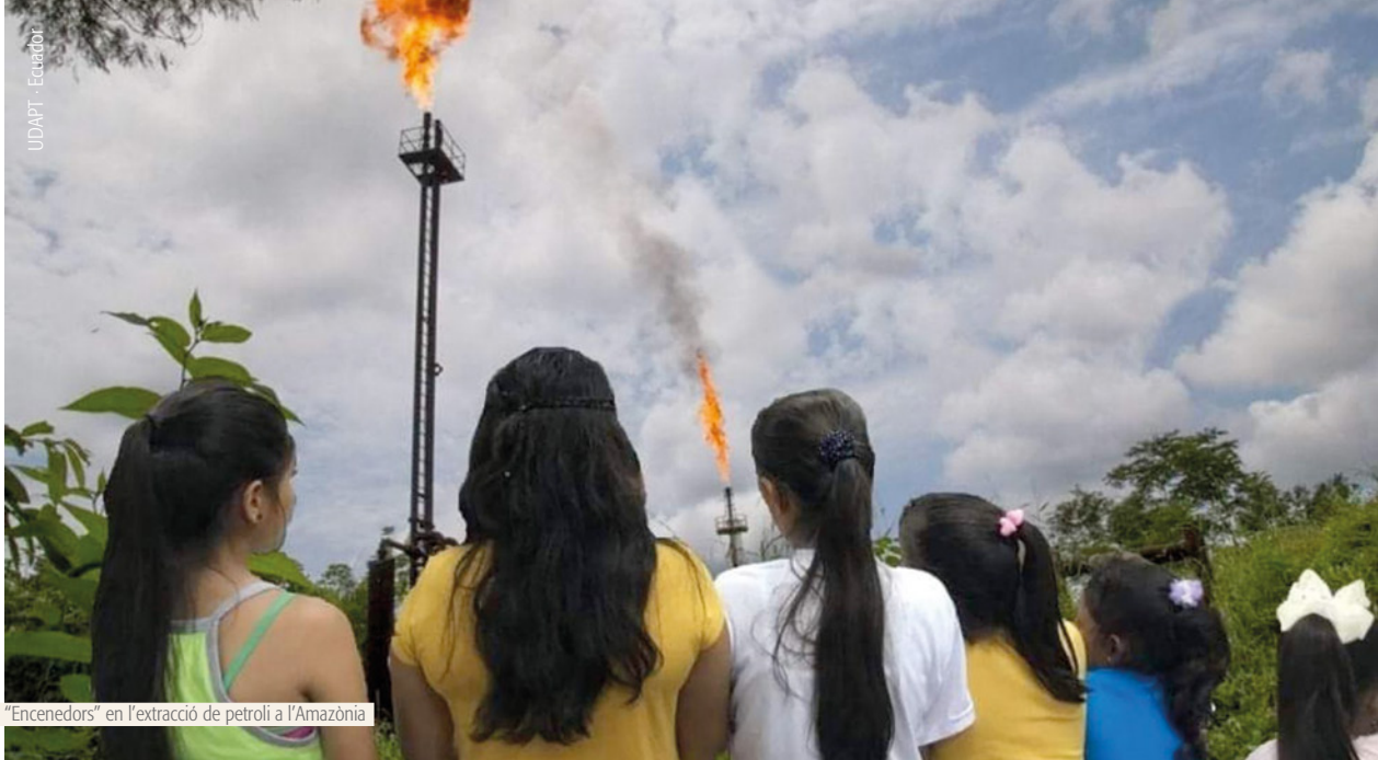
"Encenedors" en l'extracció de petroli a l'Amazònia

ment la mineria i l'agricultura, reduint la seva rendibilitat per aquests costos més grans. Alhora, el bloqueig a Rússia i Bielorússia, dos grans productors de fertilitzants, ha desencadenat tant escassetat com alts preus, i ha colpejat l'agropecuària. En alguns països, els grans agricultors s'enfocaran en cultius que requereixin menor fertilització i siguin exportables, cosa que reduirà la diversitat de la producció nacional d'aliments. En altres països les dificultats són molt més grans ja que posen en qüestió la viabilitat de petits o mitjans agricultors i l'obtenció d'aliments bàsics per a les famílies i les comunitats, com s'està denunciant al Perú i les nacions centreamericanes.