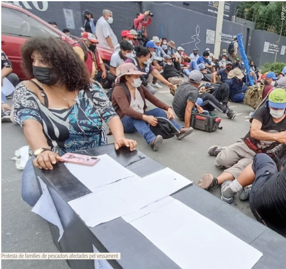
Protesta de famílies de pescadors afectades pel vessament

peruana-, Refineria La Pampilla, Transtotal Agencia Marítima i Fratelli d'Amico Armatori -italiana, propietària del Mare Doricum que transportava el cru de Brasil a Perú- sol·licitant una indemnització de 4.320 milions d'euros. Aquesta demanda es fa en nom de les 700.000 persones que l'IDECOPI considera directa o indirectament afectades.