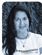
VICTORIA CANALLA ARGENTINA

Degut a la seva situació geogràfica, que el converteix en una de les portes a Europa, l’any 1985 l’Estat espanyol aprovava per primer cop una llei destinada íntegrament a legislar en matèria migratòria. L’objectiu no era altre que restringir l’arribada de persones estrangeres al territori i condemnar a la irregularitat aquelles que ja hi vivien. La llei ha patit diverses reformes encaminades principalment a fer més complexos alguns dels obstacles per a la regularització de les persones estrangeres i a afavorir-ne el retorn, augmentant l’estada màxima en un CIE o commutant penes de presó per l’expulsió del país.